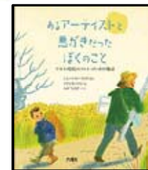
あるアーティストと 悪がきだったぼくのこと

偉大な芸術家をモデルにしたものや、美術館におさめられている絵が絵本に飛び出してくるといってもよいかなものです。是非手に取ってみてください。