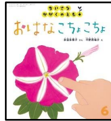
『おはなこちょこちょ』 多田 多恵子／作 平野 恵理子／絵 出版:福音館書店

どんどこ・どんどこ…ももちゃんはいそいでいます 一緒に口ずさみながらページをめくると… ももちゃんはママのもとへ…とん。